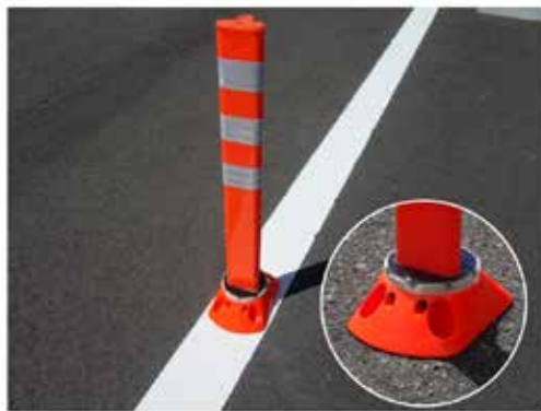
PF-SL800 定価 21,600円 (H800)