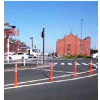
横浜の観光名所の前に設置されました!

交差点は事故が起こりやすい場所の1つです。自発光タイプも一部設置頂き、交差点入口で車両への注意喚起をしています。