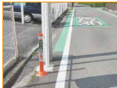
現場：神奈川県 横浜市