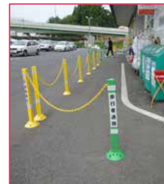
チェーンで区別が分かりやすいですね！

活用方法： 駐輪禁止対策 です。設置場所はお店の前で、 ポストフレックスにチェーン+文字 を入れて設置することで、自転車の駐輪禁止と歩行者のスペース確保に役立ちます。