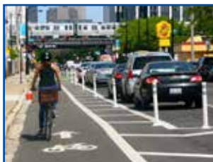
設置場所：アメリカ

日本で近年自転車に関する法改正や取り組みが始まりましたが、実は世界では既に自転車への取り組みが進んでいます。例えば、車社会のアメリカのニューヨークでは環境や市民の健康への配慮と渋滞緩和が目的で自転車を推進しており、自転車は右の写真のように自転車レーンを走行します。日本が9kmに対し、ニューヨークは1500kmの自転車レーンがあります。自転車をより活用する為にも、自転車レーンの整備は重要な課題ですね。