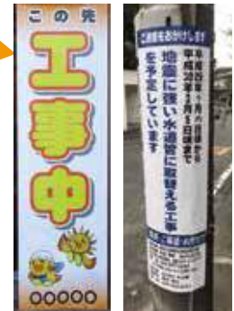
看板仕様 件名板仕様 【サイズ】H1200×W350