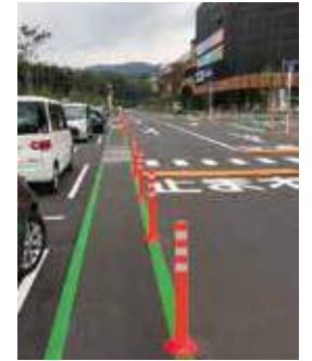
歩行者も安心して移動できます！

◆イーアス高尾とは？ 2017年6月にオープンした八王子市最大級の大型商業施設です！