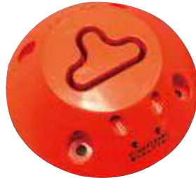
ベースは接着剤・アンカー共通

アスファルト面 は 接着剤 のみで施工可能！ 接着剤のみなら、女性でも設置出来ますね。 コンクリート面 では アンカー をご利用下さい。