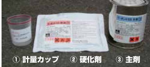
① 計量カップ ② 硬化剤 ③ 主剤